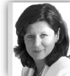
KOMMUNIKATION / WEB Sabine Köhler