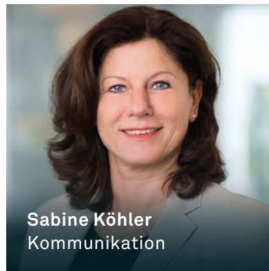
Sabine Köhler Kommunikation