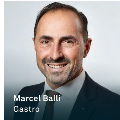
Marcel Balli Gastro